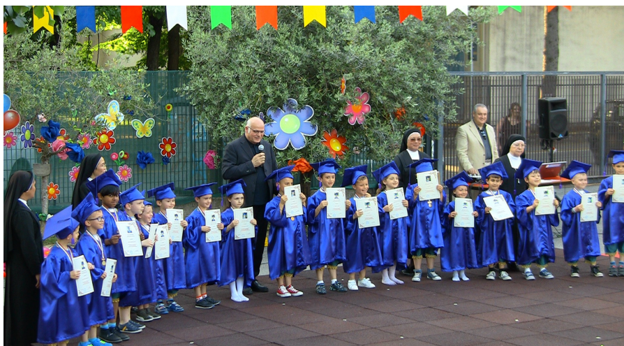
Immagine della consegna dei diplomi ai bambini che lasciano la scuola dell'infanzia per affrontare i nuovi impegni scolastici.