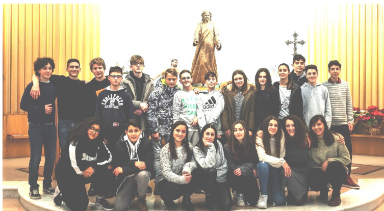
Gruppo dei ragazzi della Cresima al ritiro dai Salesiani

Questo anche e soprattutto se ci sentiamo poveri, deboli, peccatori, perché Dio dona forza alla nostra debolezza, ricchezza alla nostra povertà, conversione e perdono al nostro peccato. Il Signore è tanto misericordioso che quando andiamo da Lui ci perdona. Abbiamo fiducia nell'azione di Dio! Con Lui possiamo fare cose grandi; ci farà sentire la gioia di essere suoi discepoli, suoi testimoni». Infine ha concluso invitando a non accontentarsi di una vita "piccola": «Scommettete sui grandi ideali. Noi cristiani non siamo scelti per le cose piccole, ma per le cose grandi. Giocate la vita per i grandi ideali!».