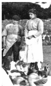
Immagine di Maria Goretti del 1902

Venne uccisa il 2 luglio 1902 per essersi rifiutata - in nome della fede in Cristo - di acconsentire alle proposte impure di un giovane di nome Alessandro. È stata proclamata Martire e Santa da Papa Pio XII nel 1950.