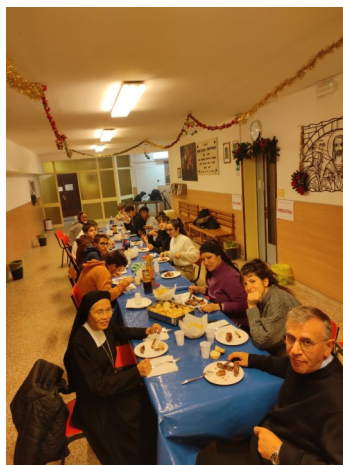
Cena giovani di seconda superiore