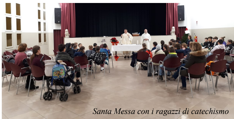
Santa Messa con i ragazzi di catechismo