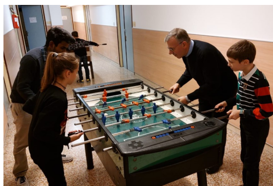
8 dicembre giornata di adesione all'Ac, un momento di condivisione durante la festa