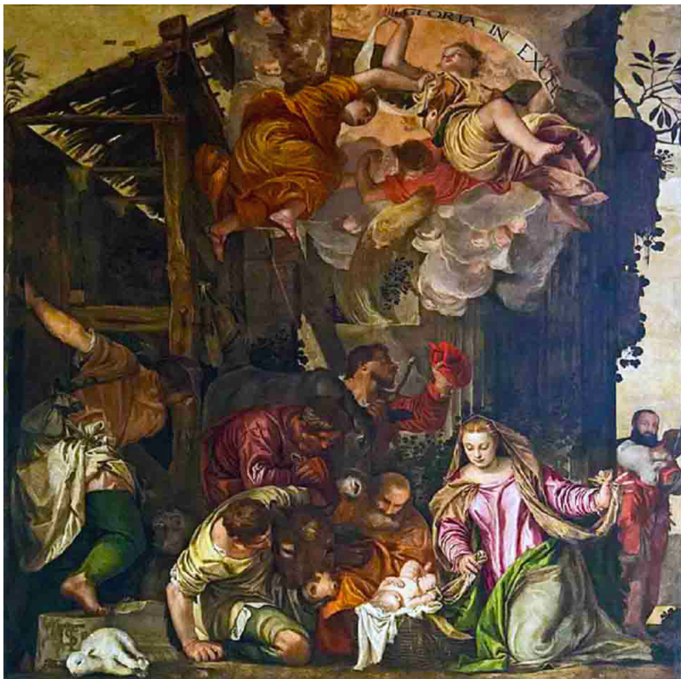
Paolo Caliari, detto il Veronese, adorazione dei Pastori, Cappella del Rosario chiesa dei SS. Giovanni e Paolo, Venezia, 1555-1565

San Bernardo di Chiaravalle, In vigilia Nativitatis Domini, Sermo III,1, PL 183