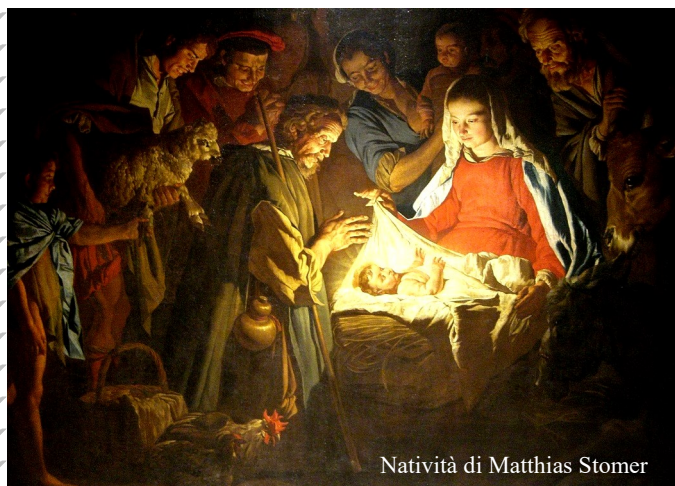
Natività di Matthias Stomer