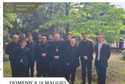
Patriarcato di Venezia

DOMENICA 18 MAGGIO FATTI PER ESSERE FELICI